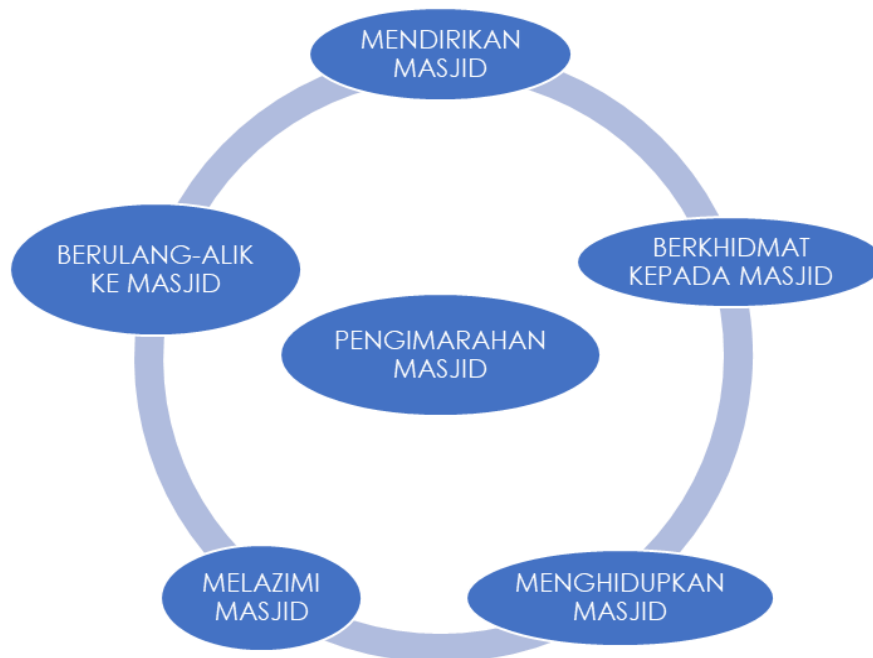
Rajah 1: Konsep Pengimarahkan Masjid

Memakmurkan masjid perlu disertakan dengan keimanan kepada Allah SWT. Kebanggaan yang sebenar ialah beriman dengan Allah dan RasulNya, beriman dengan hari akhirat dan berjihad. Orang yang benar-benar layak mengimarahkan masjid ialah mereka yang beriman dengan Allah, hari akhirat dan berkorban di jalan Allah.