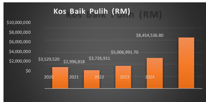
Graf 2: Statistik Peruntukan Kewangan Rumah Baik Pulih