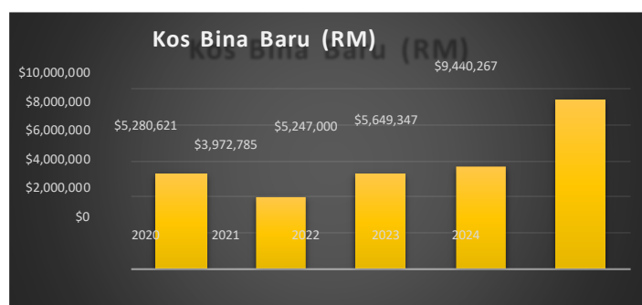
Graf 3: Peruntukan Kewangan Rumah Baru

Secara keseluruhannya, dapatan kajian menunjukkan MAIPs telah memainkan peranan yang penting dalam memastikan taraf kehidupan golongan asnaf terjamin dengan